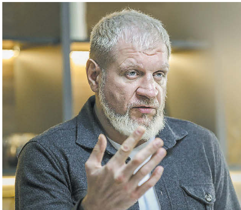
Декабрь 2022 года. Александр Емельяненко