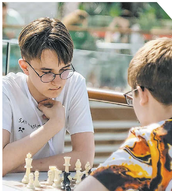
Международный турнир «Шахматные звезды 5.0»