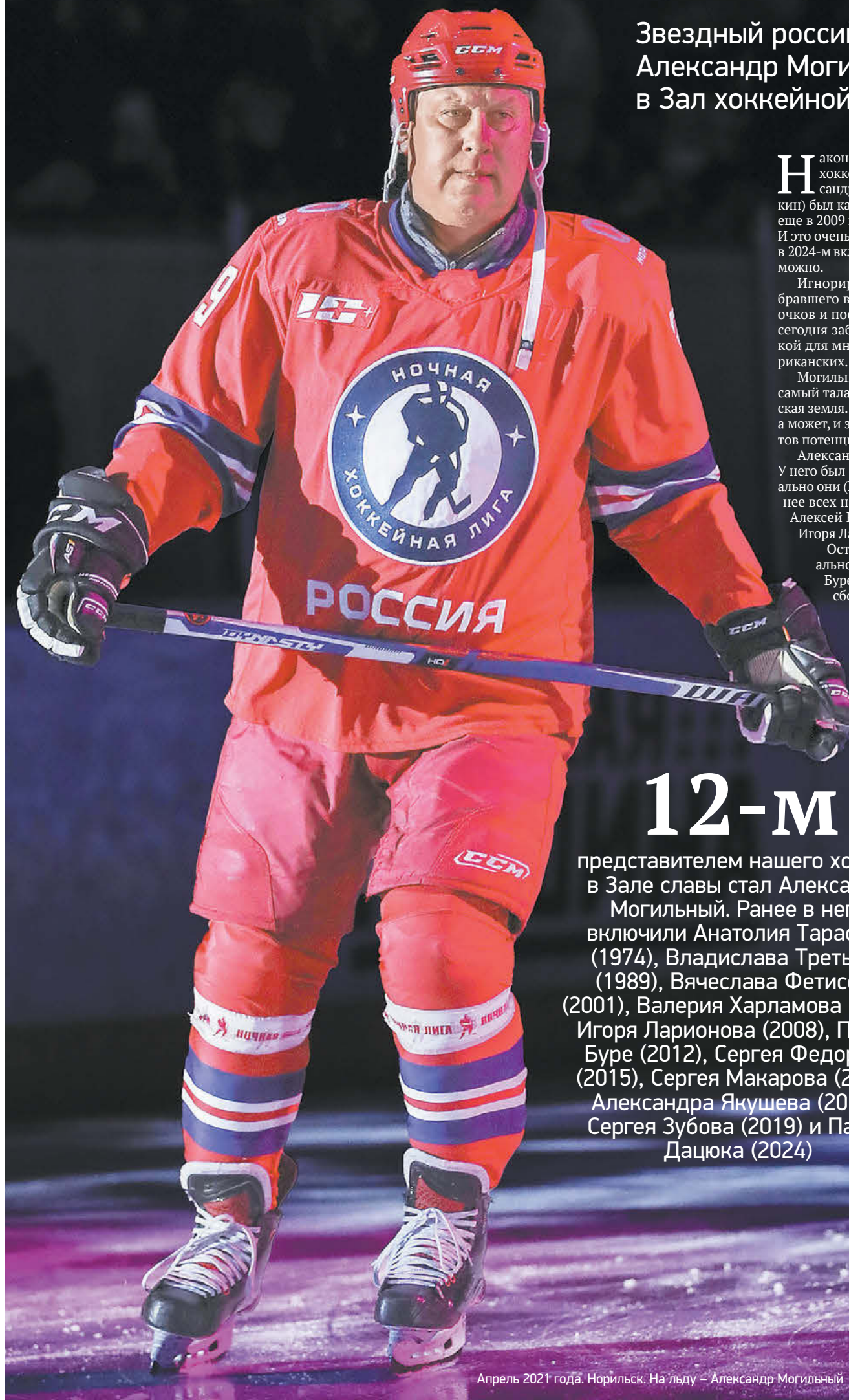
Апрель 2021 года. Норильск. На льду – Александр Могильный

Звездный российский нападающий Александр Могильный включен в Зал хоккейной славы в Торонто