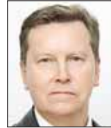
Олег НИЛОВ, депутат Государственной Думы (фракция «Справедливая Россия»):

– Чтобы России стоять крепко, уверенно, не подкашиваясь от санкционных западных ветров, нужно в первоочередном порядке решить проблему, которая как ржа железо ест страну. Поэтому предложение президента приравнять к террористам казнокрадов и коррупционеров, которые запускают хваткие руки в карман оборонной отрасли, – единственно верное. Отлучить коррупционеров и казнокрадов от бюджетной кормушки можно только жёсткими мерами, в том числе с помощью конфискации имущества, всего, что было нажито «непосильным трудом».