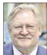
Юрий КАРА, кинорежиссёр:

– В целом президентское Послание мне понравилось и содержанием, и спокойной, уверенной интонацией. Правда, в Год культуры мы не услышали слов о нашей культуре. Понимаю, в условиях сложной внешне-политической обстановки, экономического кризиса наши производственники и бизнесмены должны были почувствовать поддержку государства. Но поддержка, как материальная, так и моральная, нужна и деятелям культуры.