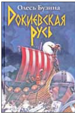
Олесь Бузина. Докиевская Русь. – Киев: Изд. «Арий», 2014. – 272 с. – 5000 экз.

Олесь Бузина – хорошо известный и в России писатель и историк, чьи труды сочетают, казалось бы, несочетаемое – основательную фактическую и документальную основу и яркий, образный стиль изложения. Неожиданные параллели, бесчисленные аллюзии, отменно храброе сопоставление времён и эпох, сочные, порой чрезмерно смелые выражения и образы, никак не вписывающиеся в научный трактат, – вот фирменный стиль Бузины. Всё это делает его книги весьма привлекательными для широких читательских масс.