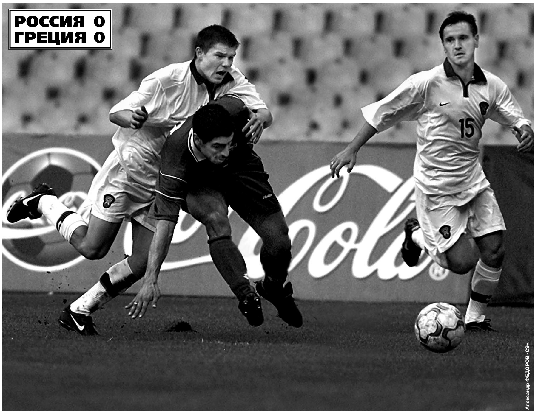
Вчера, Москва. Лужники. Россия - Греция - 0:0. 18-летнему дебютанту Марату ИЗМАЙЛОВУ (слева) хватило получаса, чтобы доказать: в сборной он появился не случайно. Его атаку готов поддержать Дмитрий АЛЕНИЧЕВ (№ 15).