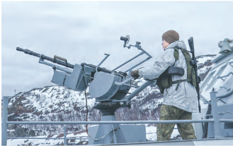
Пулемётчик катера и его надёжный товарищ.

Противодиверсионные катера проекта 21980 «Грачонки» предназначены для охраны акватории пунктов базирования и пресечения действий подводных диверсионных сил и средств противника. Высокая маневренность и оснащённость современным оборудованием и вооружением позволяют им эффективно действовать в прибрежной зоне.