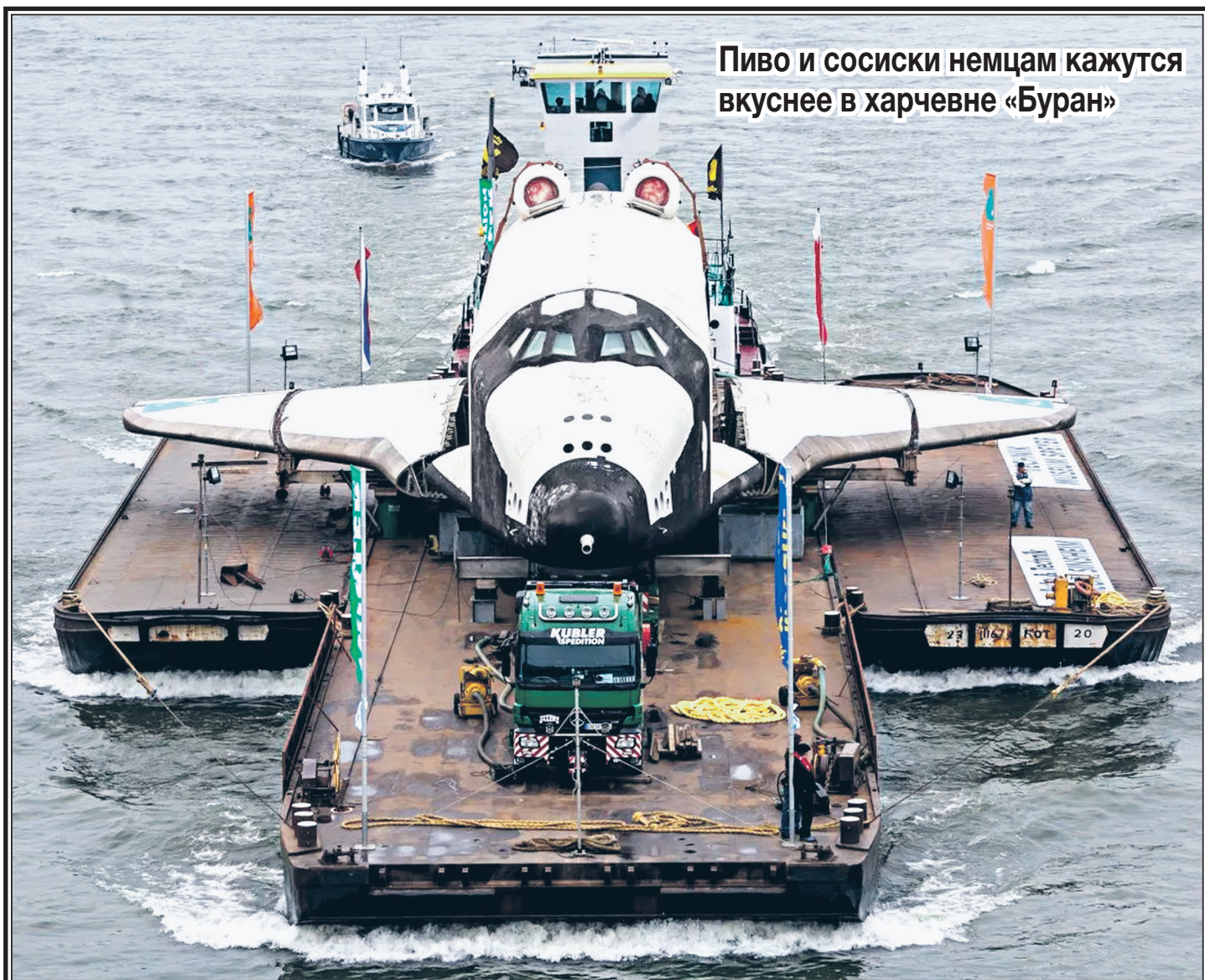
Пиво и сосиски немцам кажутся вкуснее в харчевне «Буран»