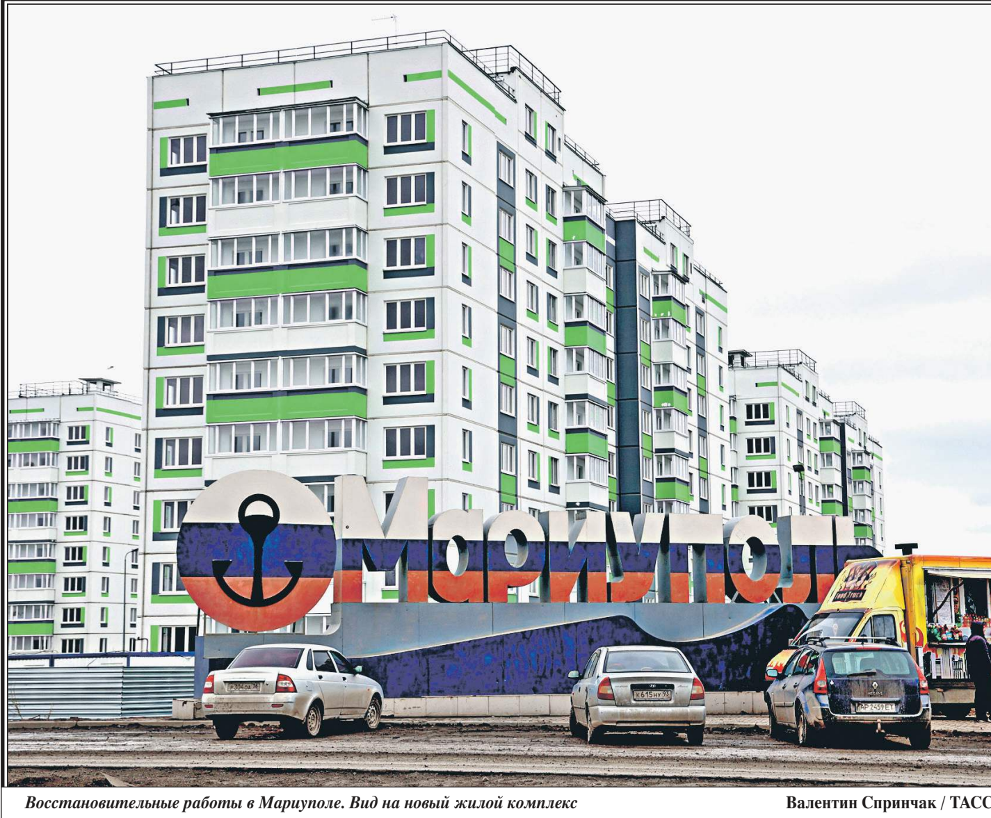
Восстановительные работы в Мариуполе. Вид на новый жилой комплекс