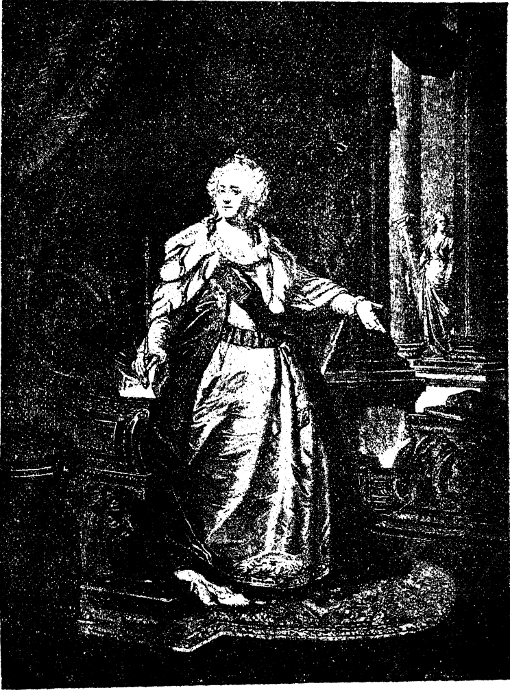
Императрица Екатерина II. Съ портрета Лампи.

Когда Вольтеръ торопилъ Екатерину (въ 1767 году) въ ея