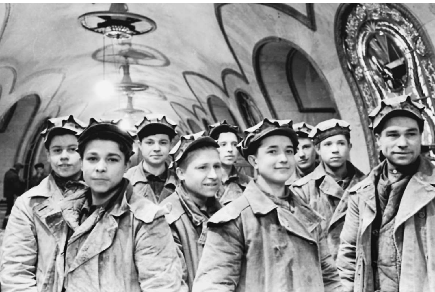
Лучшее в мире, по мнению москвичей, метро построили «лимитчики»

Воспитательный довод «Учись, оболтус, в Москву поедешь в институт поступать» устаревает. Если раньше, чтобы покорить столицу, подростку надо было быть семи пядей во лбу, то сейчас гораздо дальновиднее не блистать оценками, а проявлять интерес к карьере мастера. Столичная власть пытается возродить систему ПТУ — профессионально-технических училищ. Специально для приезжих из регионов России и стран СНГ.