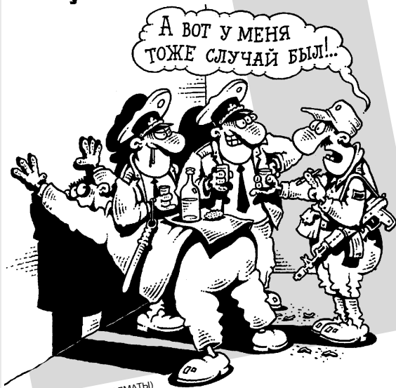
РИС. И. КИЙКО (АЛМАТЫ)

В Америке родилась девочка с четырьмя миллиардами долларов!