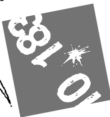
РИС. И. КИЙКО (АЛМАТЫ)

Президент подписал указ о продлении репродуктивного возраста у мужчин до 95 лет!