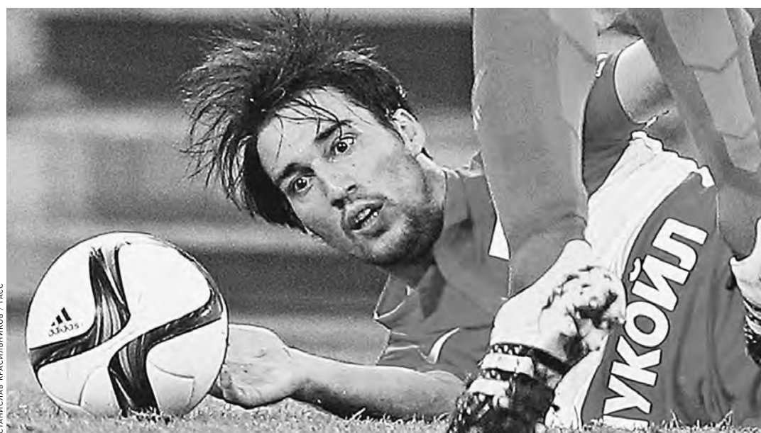
Футболисты «Спартака» не теряют надежды на чемпионство. Но обыграть «Локомотив» им будет непросто.

Звонкая афиша матча подкре- плена турнирным раскладом: «Локомотив» нынче идет на вто- ром месте, а «Спартак» замыкает лидирующую четверку. Победа не позволит ни одной из команд существенно улучшить свое по- ложение в таблице чемпионата: она важна прежде всего с точки зрения погони за лидирующим ЦСКА, который откроет тур до- машним матчем против екатеринбургского «Урала».