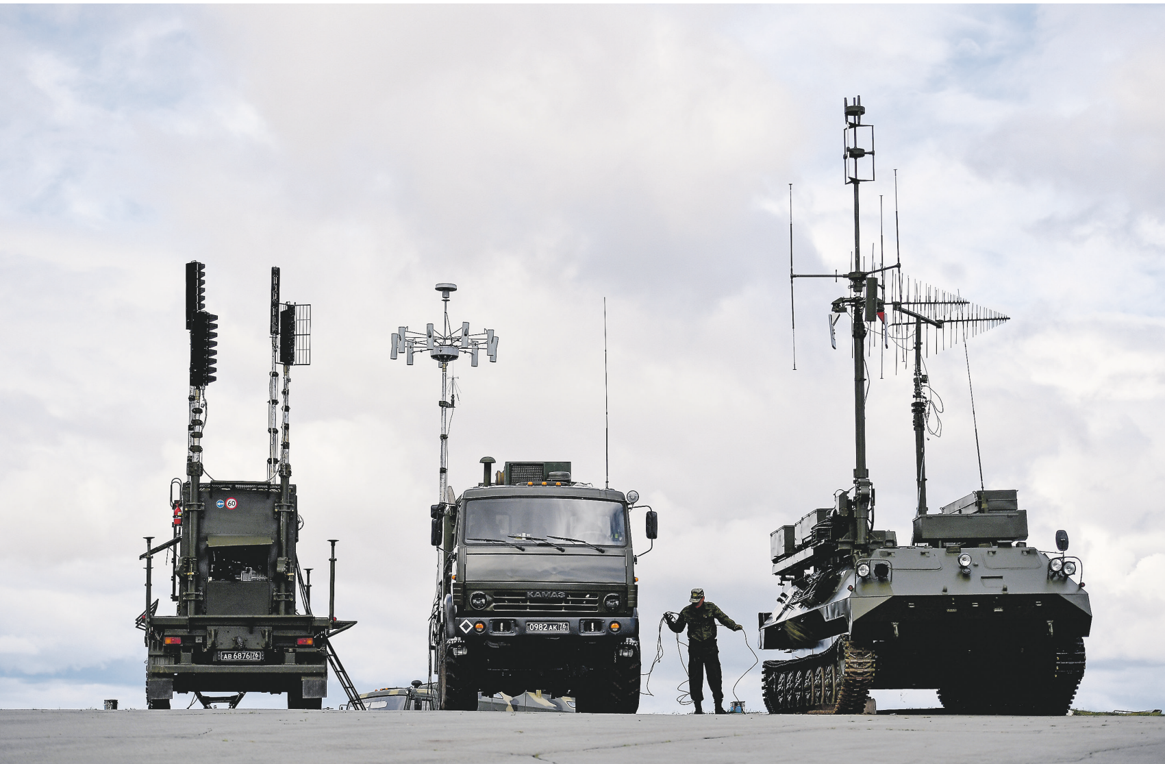
Системы радиоэлектронной борьбы помогут ополченцам противостоять беспилотникам ВСУ

26 января секретарь генсовета партии «Единая Россия» Андрей Турчак заявил, что в условиях масштабных поставок Украине летального оружия из стран НАТО он считает правильным передать ЛНР и ДНР отдельные виды вооружений. 02 →