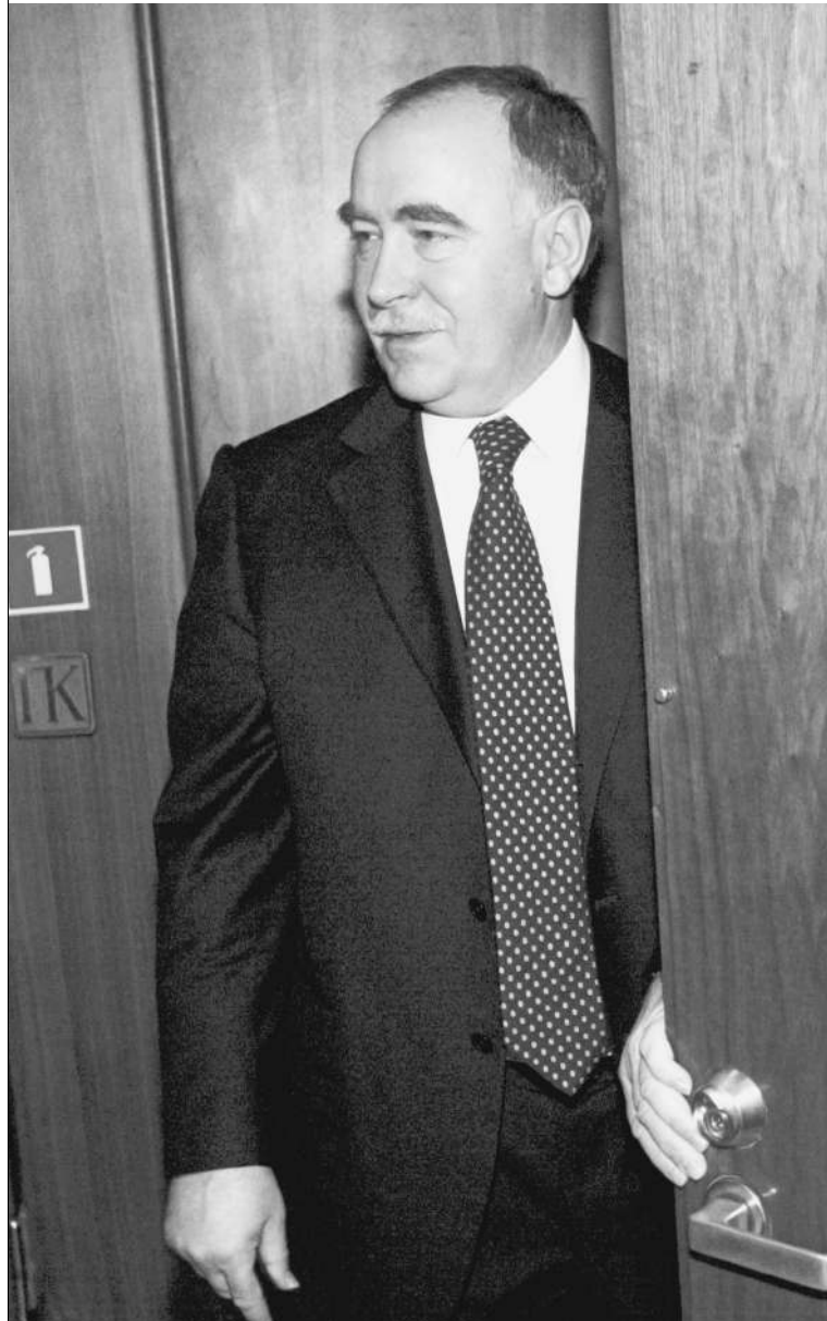
Виктор Иванов будет грозить российским взяточникам международными нормами

Президентский Совет по коррупции больше не существует — его заменит межведомственная рабочая группа, которую возглавит помощник главы государства Виктор Иванов. Как говорится в опубликованном вчера указе, до 1 августа группа должна будет представить свои предложения по изменению законодательства. Формальный ориентир — Конвенция ООН против коррупции и Конвенция Совета Европы об уголовной ответственности за коррупцию. Оба эти документа Россией ратифицированы, но их требования до сих пор не выполнены. → стр. 2