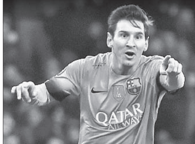
Вчера. Лондон. «Арсенал» - «Барселона» - 0:2. 71-я минута. Только что Лионель МЕССИ открыл счет.

Дубль Лионеля Месси в Лондоне фактически решил исход противостояния «Барселоны» с «Арсеналом». А вот «Бавария» Пепа Гвардьолы, ведя в два мяча, упустила победу в Турине.