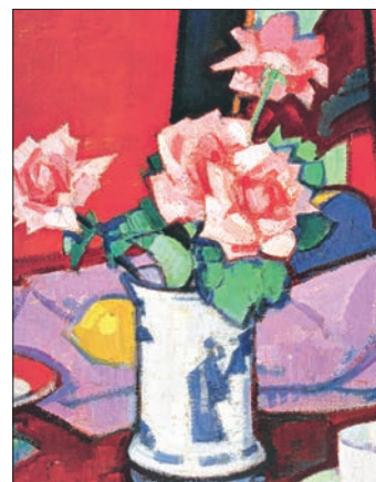
Самюэль Джон Пепло. Розы в китайской вазе. 1916–1920. Холст, масло, 45,7×41. Национальная галерея Шотландии, Эдинбург