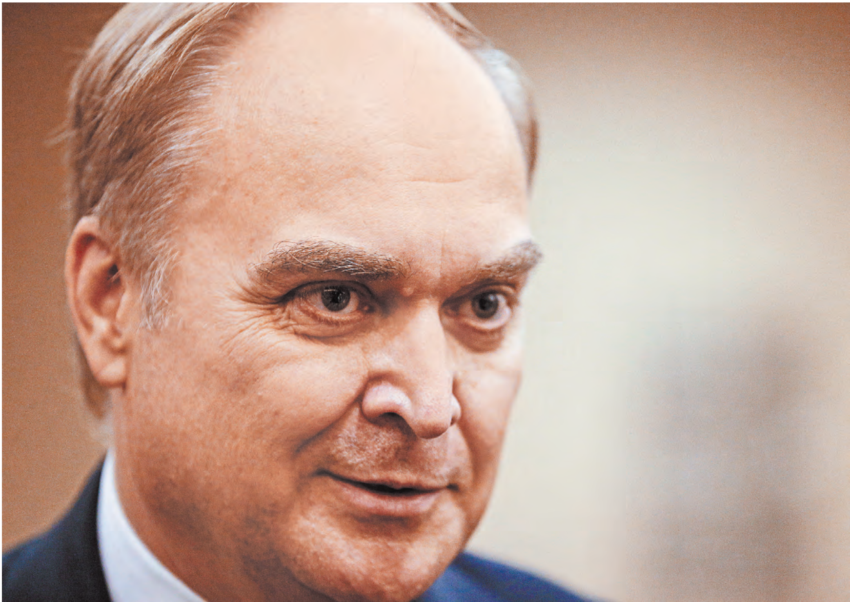
АЛЕКСАНДР ШЕРЯК / ТАСС