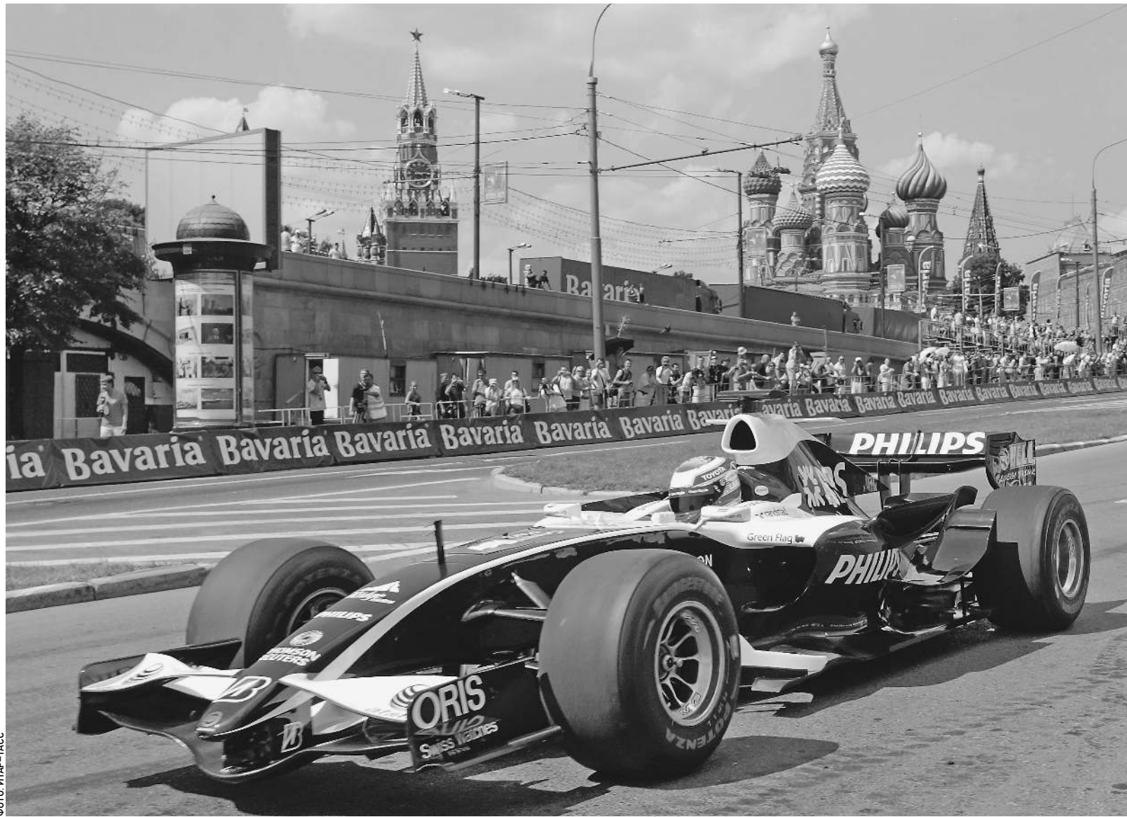
Для того, чтобы прокатиться на болидах, требуются большие партнерские взносы

Алекперов и Дерипаска не могут согласовать схему финансирования чемпионата мира в Сочи