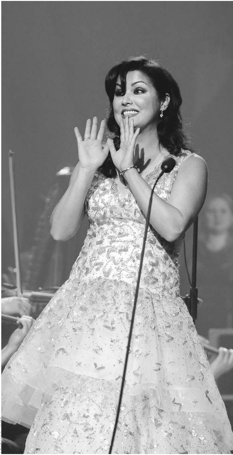
Анна Нетребко отказалась от поездки в Японию под благовидным предлогом

Почему Нетребко отказалась ехать в Японию? Русская оперная дива Анна Нетребко в последний момент отказалась ехать на давно запланированные гастроли в Японию вместе с труппой нью-йоркской Metropolitan Opera, сославшись на то, что опасается радиационного заражения. Вероятнее всего за этим стоят Валерий Гергиев и Конкурс Чайковского →07