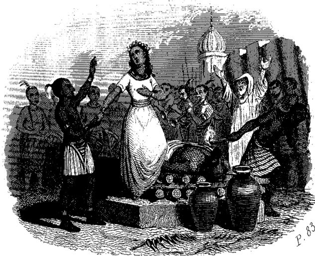
Sacrifice d'une hindoue sur le tombeau de son mari.