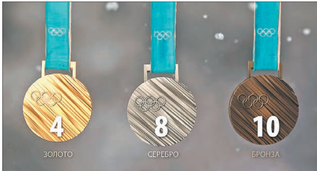
Наш прогноз на медали России в Пхенчхане.