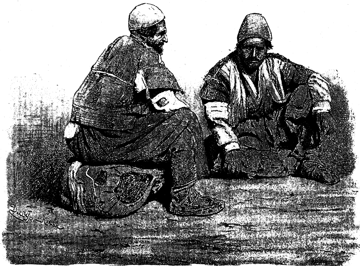
«Муши» — носильщики.

Ночь была тоже совершенно тихая и темная; синяя глубина неба густо усыяна ярко свѣтящимися звѣздами, которыя совершенно ясно отражаются въ морѣ. Свѣтлой ясной полосой тянется по небу млечный путь, тоже отражающійся въ водѣ. Не хочется ух-