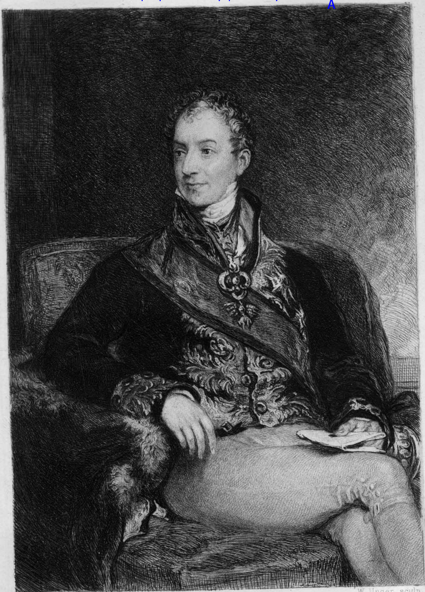
Th. Lawrence pinx.