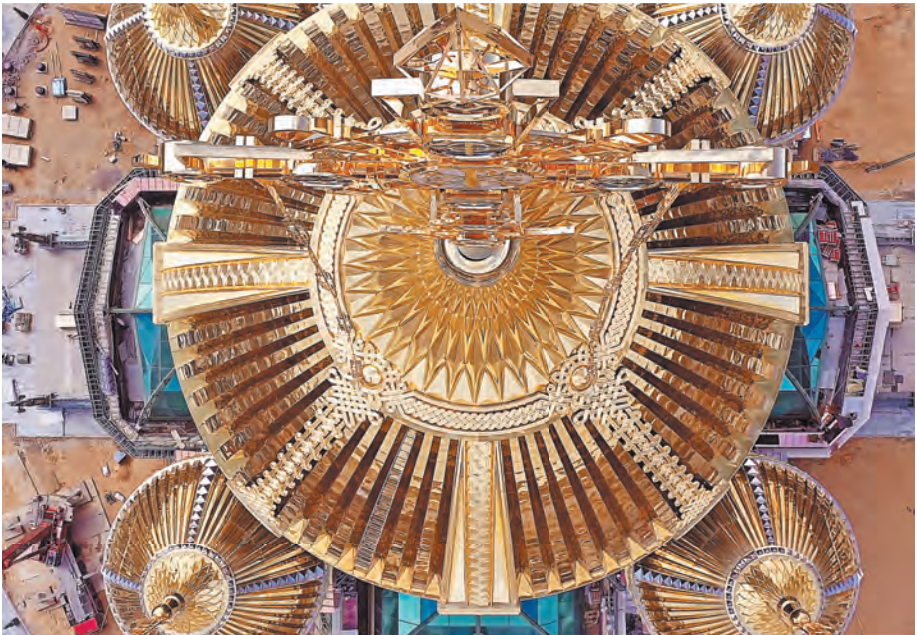
Главный храм Вооруженных сил России станет третьим по величине в России и четвертым — в мире.

ТРУД Ждут ли нас массовое исчезновение профессий и переход на удаленку