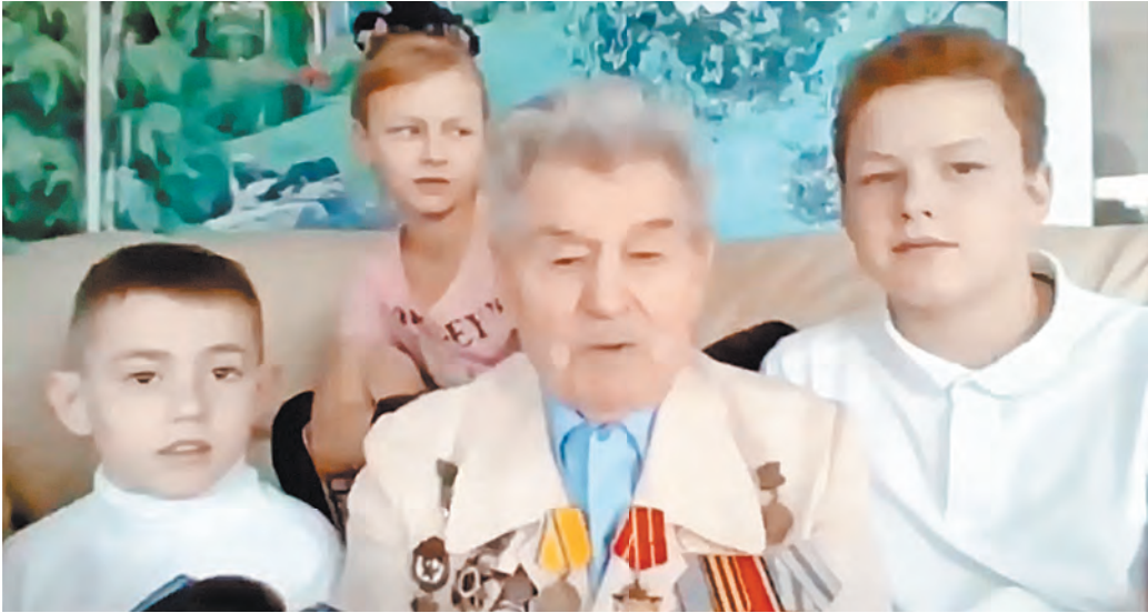
В доме у деда в поселке Рамзай сейчас не так многолюдно. Но младшие из правнуков «в космос» напросились...