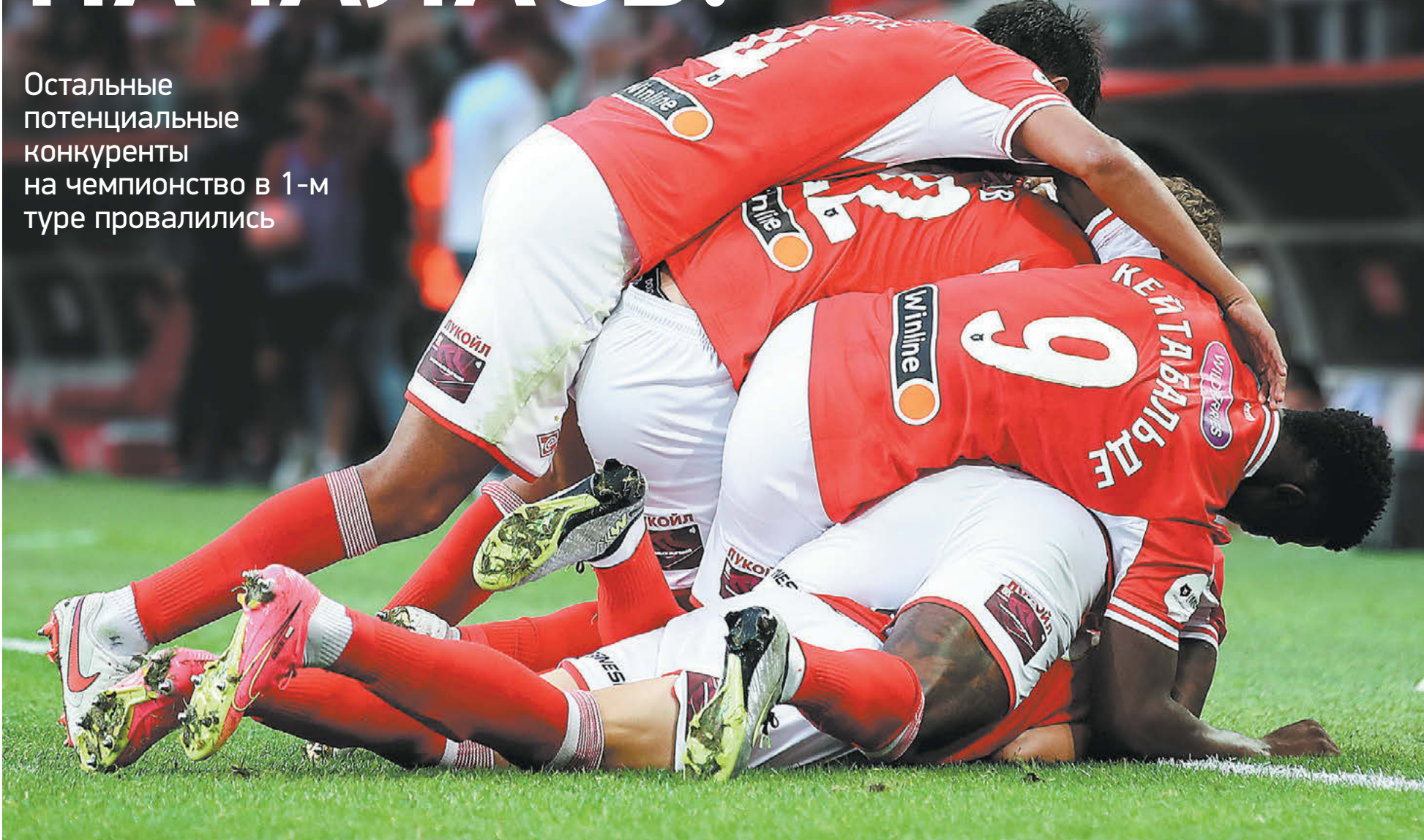
Вчера. Москва. Тушино. «Спартак» – «Оренбург» – 3:2. 90+1-я минута. Победная куча-мала – только что Даниил Хлусевич забил победный гол

Остальные потенциальные конкуренты на чемпионство в 1-м туре провалились