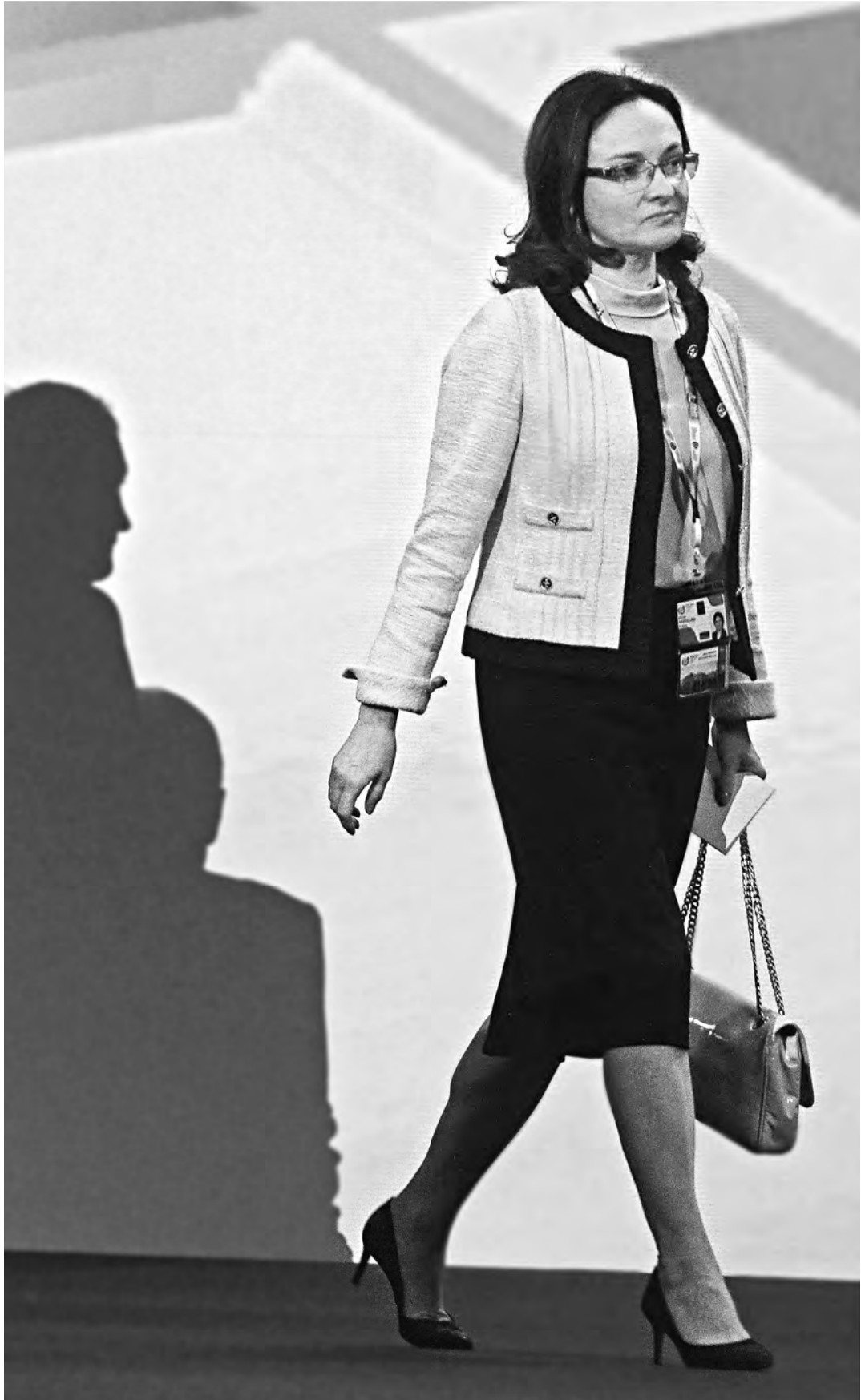
Основная цель, к которой идет глава Центробанка Эльвира Набиуллина, — укрощение инфляции.

О ЧЕМ ГОВОРЯТ Куда летит космический «Прогресс»