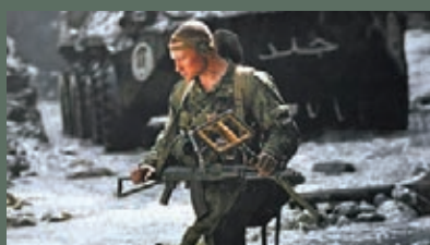
ФОРМИРОВАНИЕ ЛИЧНОСТИ ВОИНА