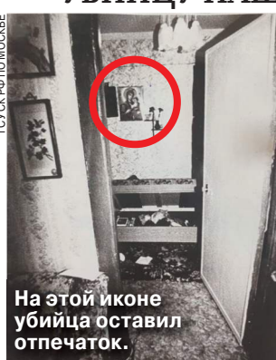
На этой иконе убийца оставил отпечаток.

Следователи столичного ГСУ СКР смогли слить единственный четкий отпечаток пальца, оставленный на священной иконе, с базой данных и разоблачили преступника. Как стало известно «МК», труп 53-летней женщины был обнаружен в доме по 3-му Волоколамскому проезду в конце октября 1995 года — ее задушили собственными реузами. Единственный качественный отпечаток, оставшийся на иконе, на тот момент ничем не помог.