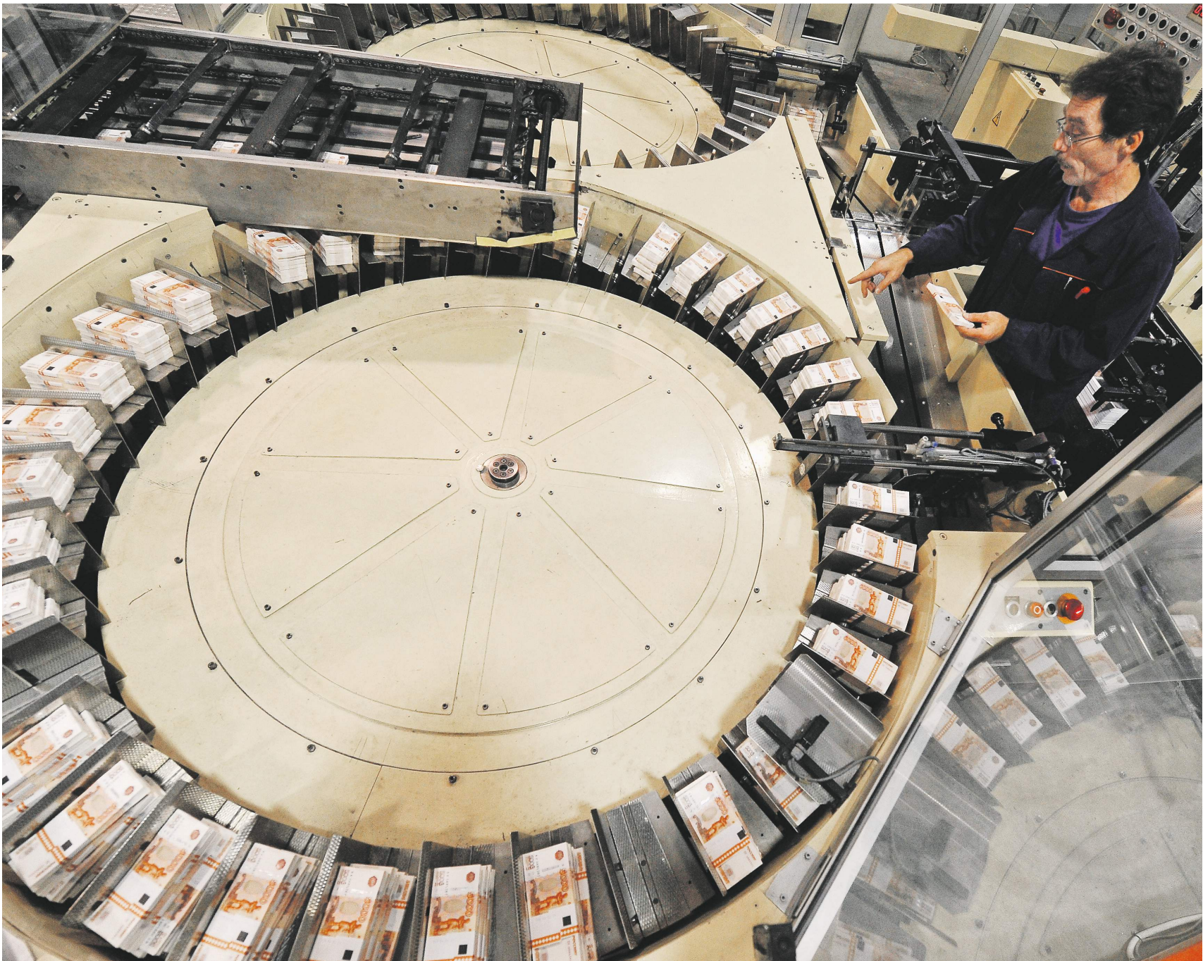
Алексей Куликов / РИА Новости

В нынешнем году произошёл обратный процесс. В первой половине 2020-го Центробанк допечатал 460 млн купюр, сообщила «Известиям» пресс-служба регулятора.