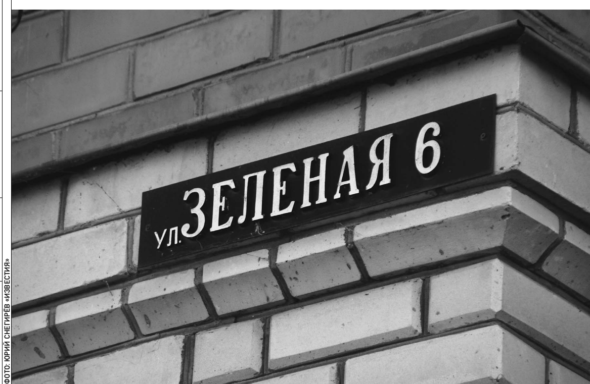
Этот адрес в станице Куцевская знает вся страна. Здесь в ночь на 5 ноября были убиты 12 человек

Станица Куцевская два десятилетия считалась благополучной, но жила под игом бандитов. Здесь убивали фермеров, насиловали женщин, занимались рэкетом. Преступления оставались нераскрытыми, люди не писали заявления в милицию. Преступной группировкой руководила семья депутата районного собрания. Так считают следователи, которым предстоит все это доказать. Каждый день открываются все новые факты беспредела, который творился на глазах у 35 тысяч станичников.