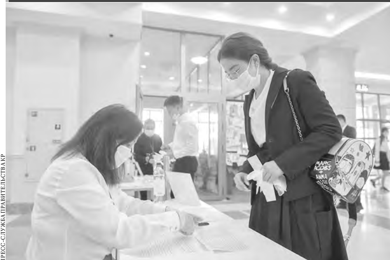
ПРЕСС-СЛУЖБА ПРАВИТЕЛЬСТВА КР

В Бишкеке прошло тестирование кандидатов на школьные аттестаты особого образца — претендентов на так называемую золотую медаль. Итоговая государственная аттестация проводилась в режиме реального времени со строгим соблюдением санитарно-эпидемиологических требований. Для участников специально разработали график явки, чтобы не допустить скопления детей в коридорах и зонах отдыха. Школьникам обрабатывали руки, измеряли температуру и затем рассаживали их на расстоянии как минимум полутора метра друг от друга.