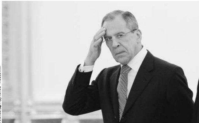
За право советовать министру Лаврову американцы готовы доплачивать

При этом компания «не получила никаких поступлений, доходов или иных средств в каче-