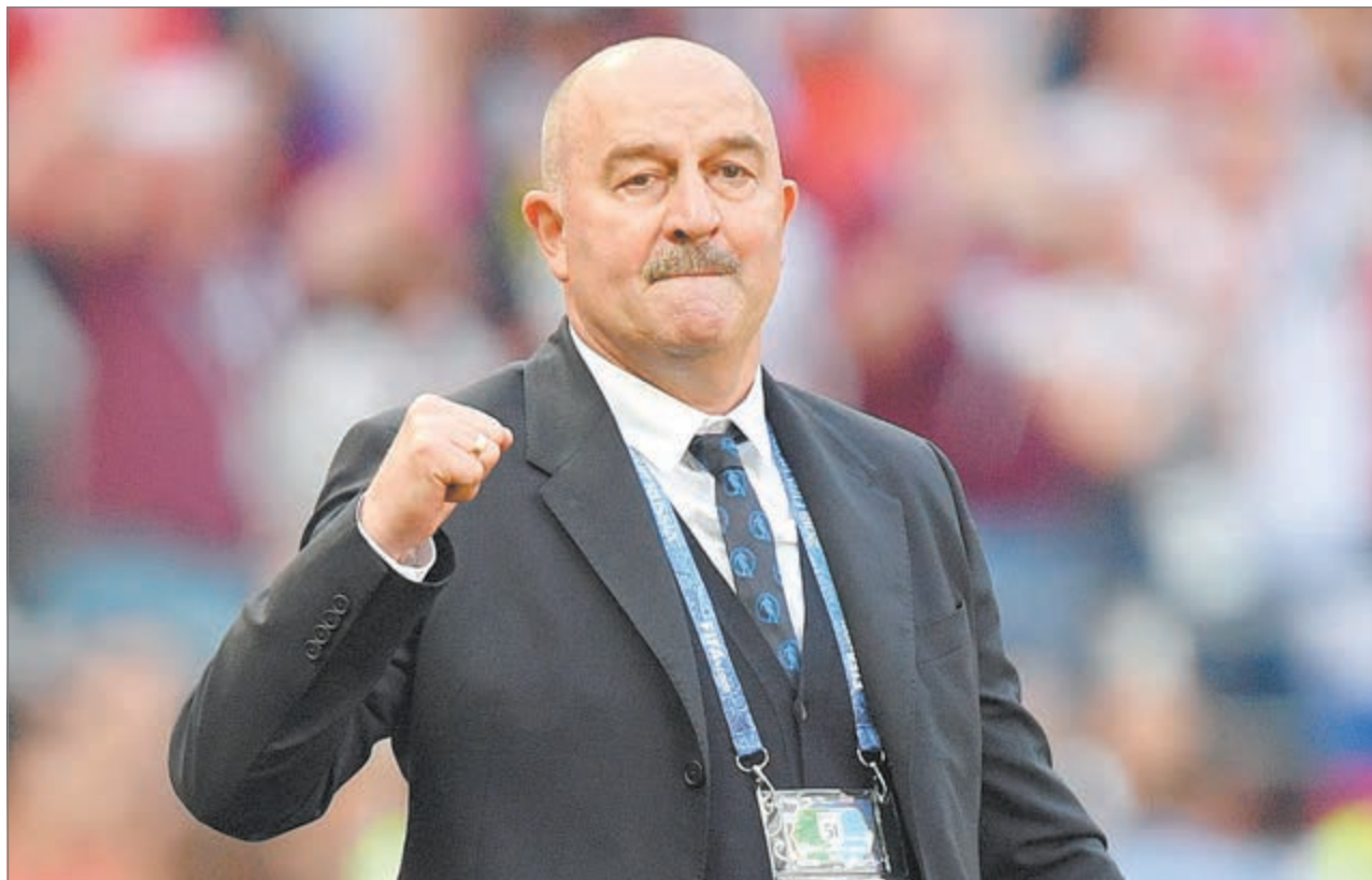
Главный тренер сборной России Станислав ЧЕРЧЕСОВ.

Впервые в своей истории сборная России поднялась в рейтинге сразу на 21 позицию. До этого наибольший скачок был зафиксирован в октябре 2010-го - плюс 15 мест.