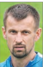
Сергей СЕМАК, главный тренер «Зенита»

«Рад и горд за команду. Героическая игра. Команда сама поставила себя в такое положение и с честью вышла из него. Тем слаще победа».