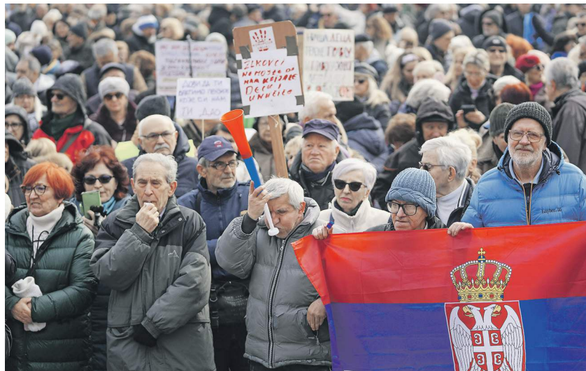
Западные НКО подогревают протесты в Сербии (на фото — митинг в Белграде, 5 февраля)