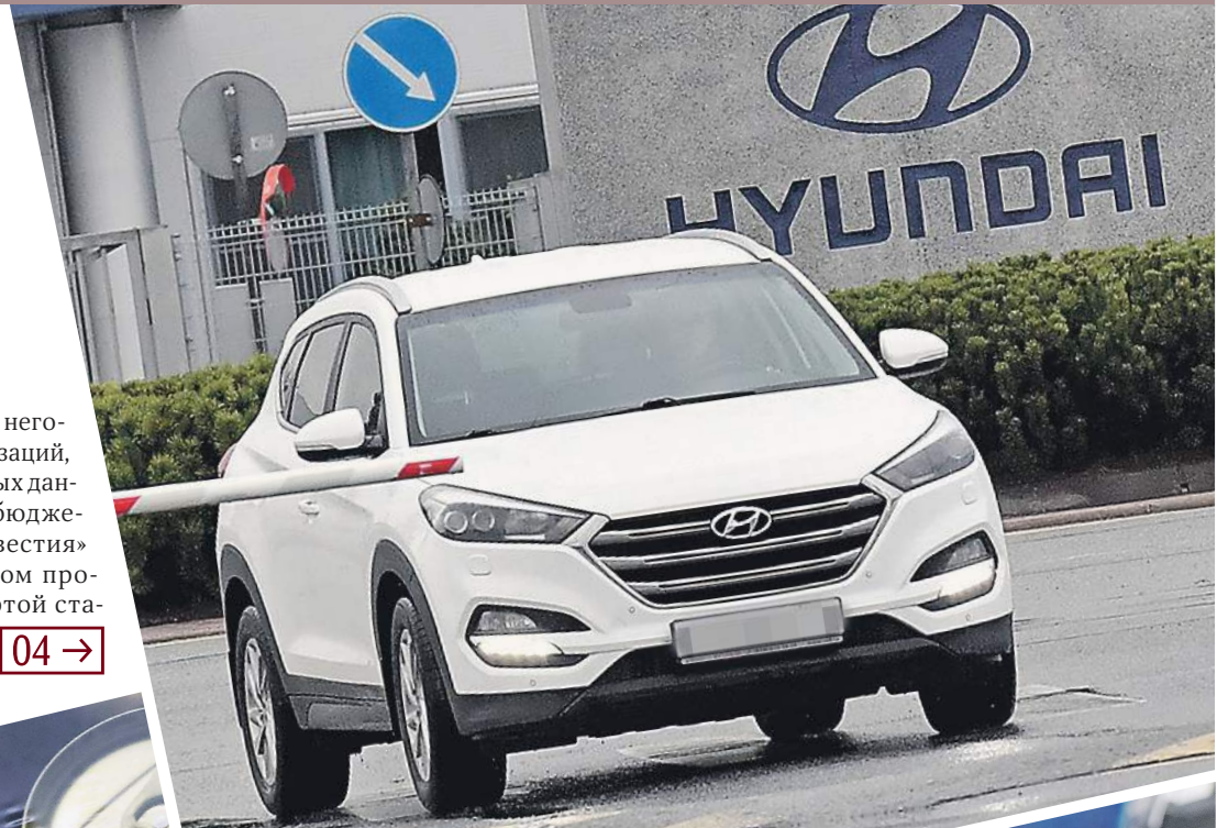
Свои Опции / Известия