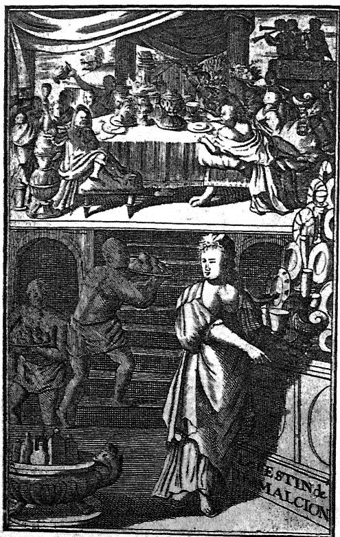
LE FESTIN DE TRIMALCION