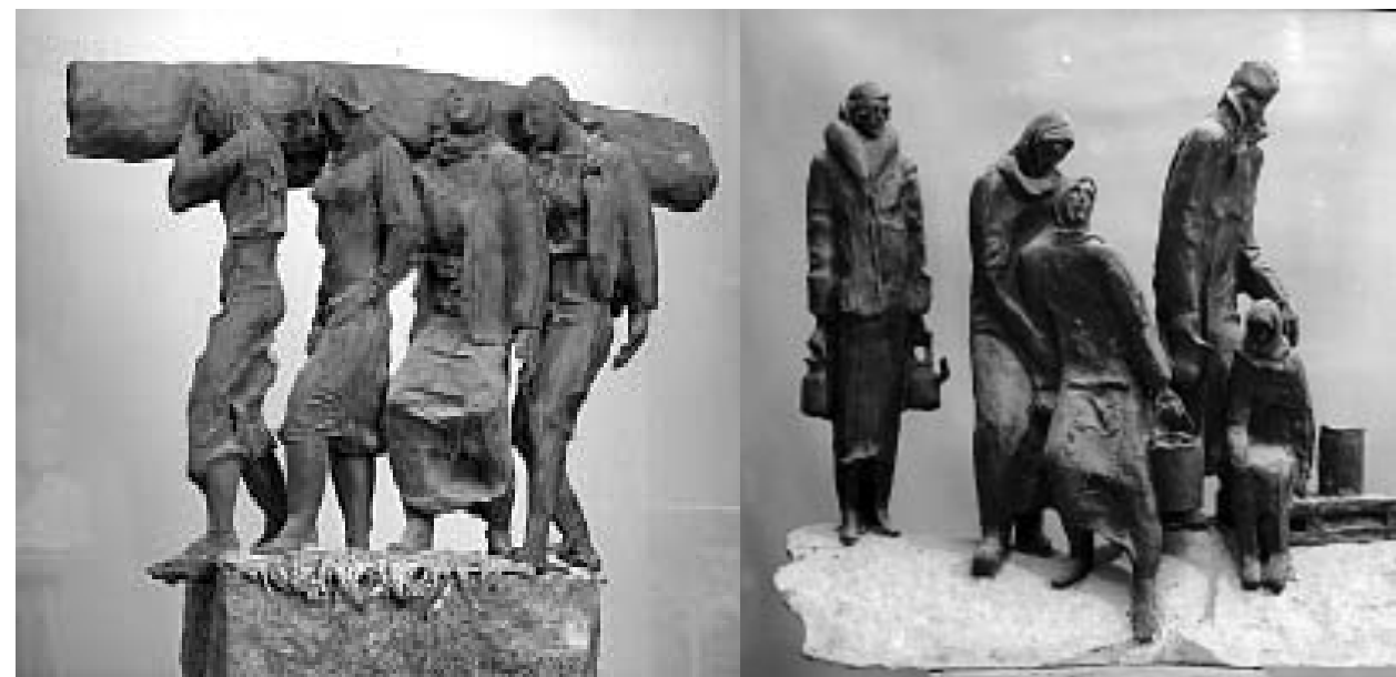
На оборонных работах