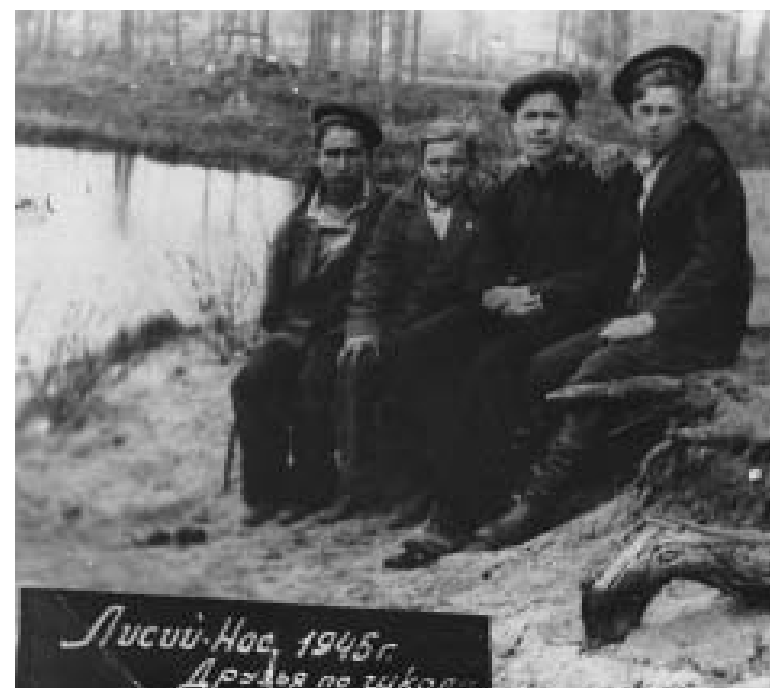
Лисий Нос, 1945 год. Друзья по школе