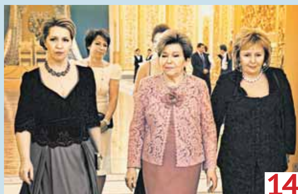
Фото с историей: Три ПЕРВЫЕ ЛЕДИ