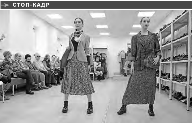
Необычный показ мод устроил для своих подопечных благотворительный фонд «День добрых дел». Вся одежда, которую демонстрировали модели, не из бутиков, а благотворительного склада «Хорошие руки», который безвозмездно обеспечивает бывшими в употреблении вещами малоимущих, многодетных и пенсионеров. Стилисты и психологи научили гостей, как одеваться, чтобы выглядеть модно и не переставать радоваться жизни.