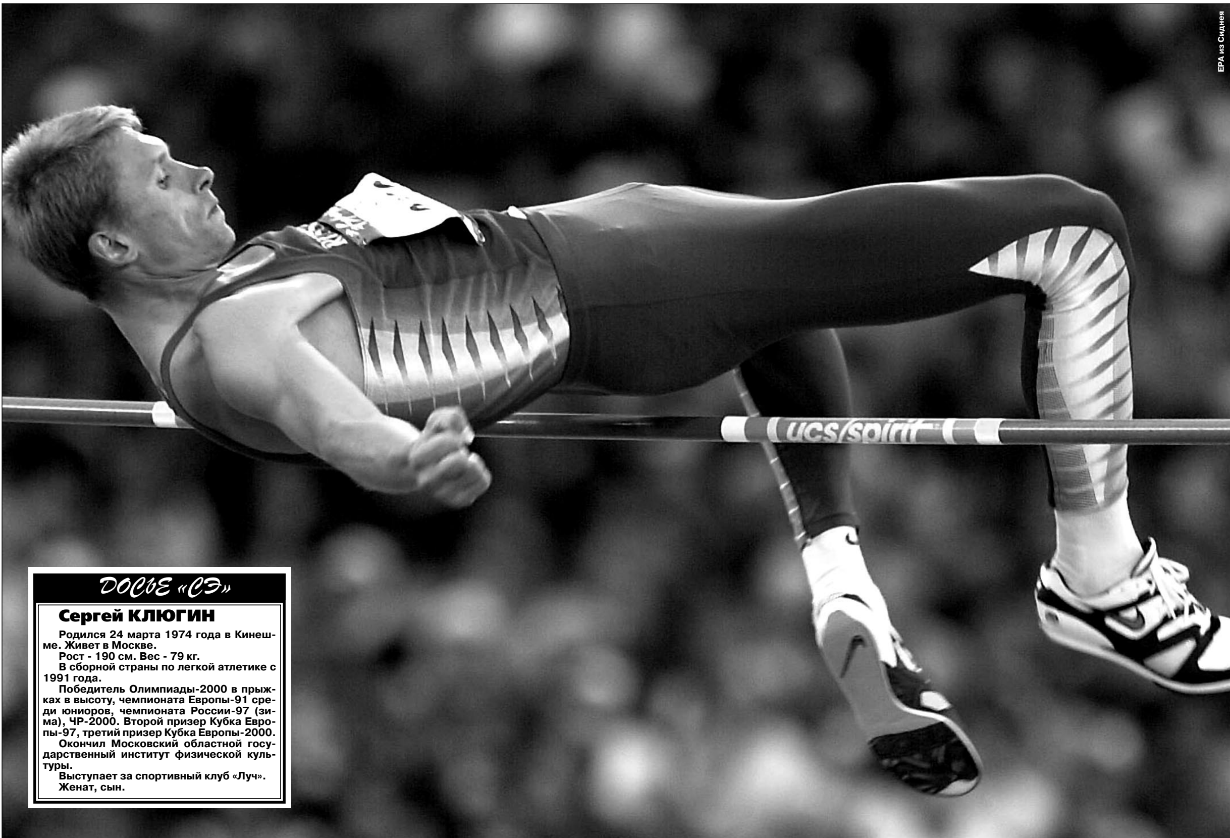
ЕРА из Сиднея