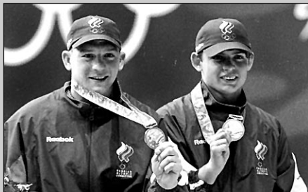
Дмитрий САУТИН и Игорь ЛУКАШИН , синхронные прыжки в воду с вышки

СЕМЬ золотых медалей завоевала Россия в минувший уик-энд. Причем 5 из них - в прыжковых видах программы!