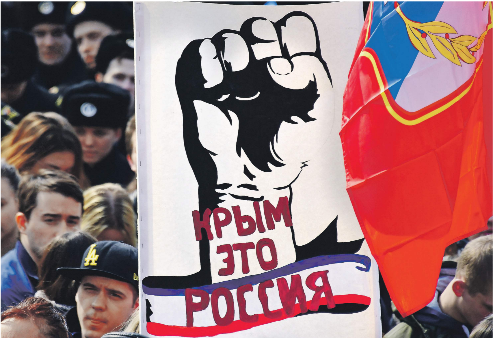
Деловое сообщество давно признало Крым и Севастополь частью России

В то же время основными бенефициарами ситуации в регионе стали Россия и Норвегия как основные сырьевые экономики в Европе. Так, прирост их доходов по сравнению с первоначальным прогнозом составил примерно 1,5% ВВП в каждой стране. Прогноз по ВВП России на 2018 год остался неизменным — 1,7%, однако на 2019-й был повышен с 1,5 до 1,8%. 02 →