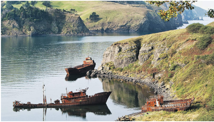
Острова Шикотан и Хабомаи по декларации 1956 года могли перейти от России к Японии

— Любые политические мотивированные ограничения, которые переходят в сферу экономики, мешают развитию