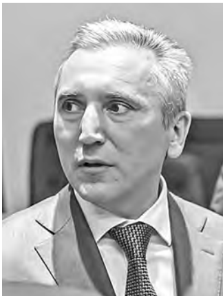
Александр Моор поступил на госслужбу в 2001 году.