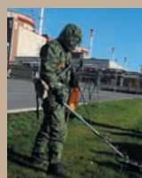
ВОЙСКА ГОТОВЫ К ОТРАЖЕНИЮ ЛЮБЫХ УГРОЗ

ДОКТРИНАЛЬНЫЕ ВЗГЛЯДЫ НАТО НА ХАРАКТЕР ВОЙН И ОБЕСПЕЧЕНИЕ БЕЗОПАСНОСТИ