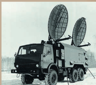
ВОЕННЫЕ СИСТЕМЫ СПУТНИКОВОЙ СВЯЗИ