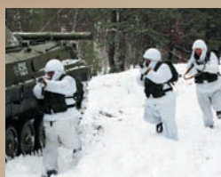
НОВЫЙ ОБЛИК НОВОГО ОКРУГА