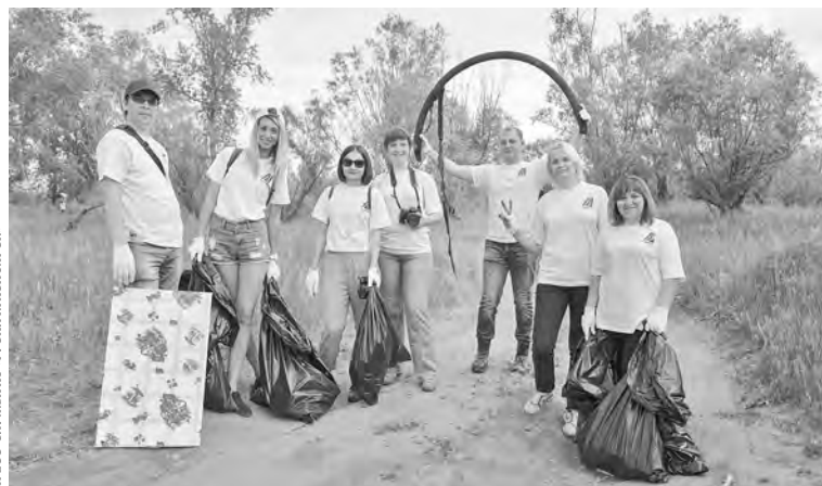
В Красноярске уже в девятый раз проходит экологический марафон «День Енисея». В этот раз на берег реки в районе косы Орлиха, что в Советском районе краевого центра, вышло более 400 волонтеров — студентов и преподавателей, рабочих-металлургов, предпринимателей, служащих и чиновников. Все вместе они собрали 4 тонны мусора, сделав берег Енисея здесь гораздо чище.