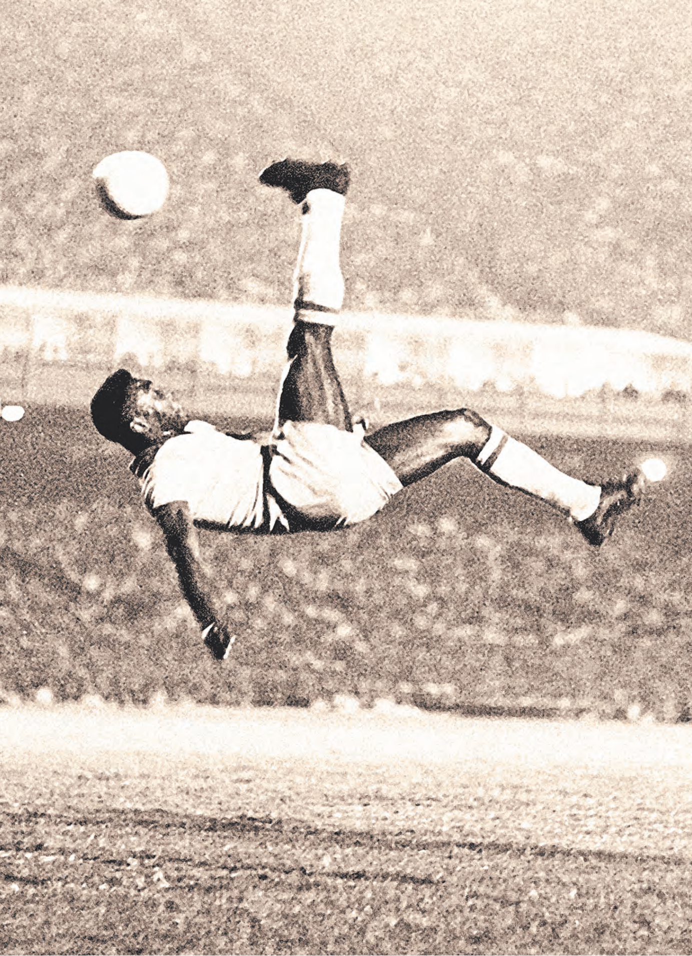
Гол в королевском стиле.