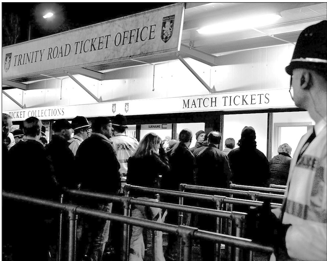
Благополучие такого клуба, как «Ливерпуль», во многом зависит от посещаемости матчей. Владельцы сезонных абонементов оставляют тем, кто предпочитает покупать билеты на отдельные игры, не очень много возможностей попасть на стадион.