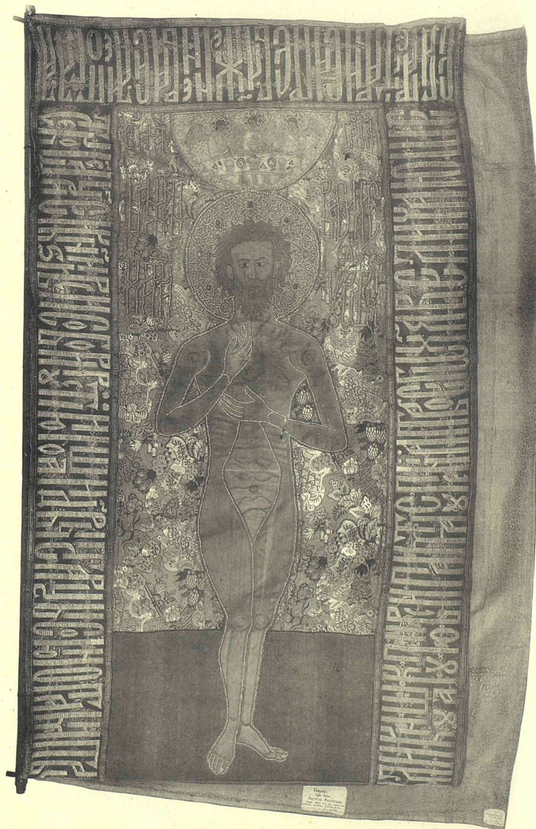
Покровъ на гробницу Василия Блаженнаго. Вкладъ дѣда Михаила Ѳеодоровича, царя Ѳеодора Ивановича (сына царицы Анастасіи Романовой). Украшенъ жемчугомъ, а вѣнецъ драгоцѣнными камнями. Покровскаго Собора.