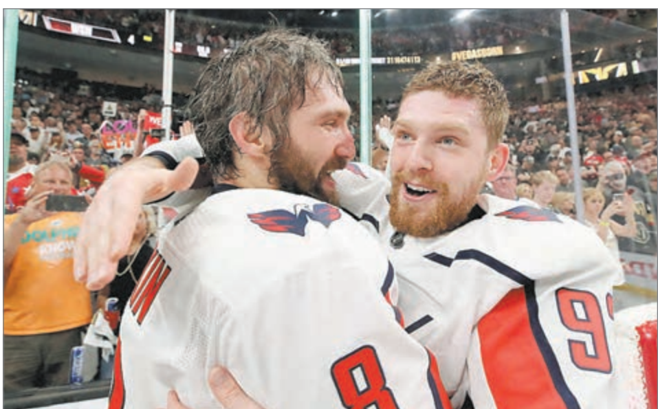
8 июня 2018 года. Лас-Вегас. «Вегас» - «Вашингтон» - 3:4. Чемпионы прошлого сезона Александр ОВЕЧКИН (слева) и Евгений КУЗНЕЦОВ вылетели с «Кэпиталс» из Кубка Стэнли в первом раунде и готовы приехать в сборную.