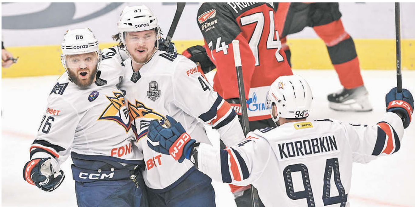
Вчера. Омск. «Авангард» – «Металлург» – 1:3. Победные эмоции гостей