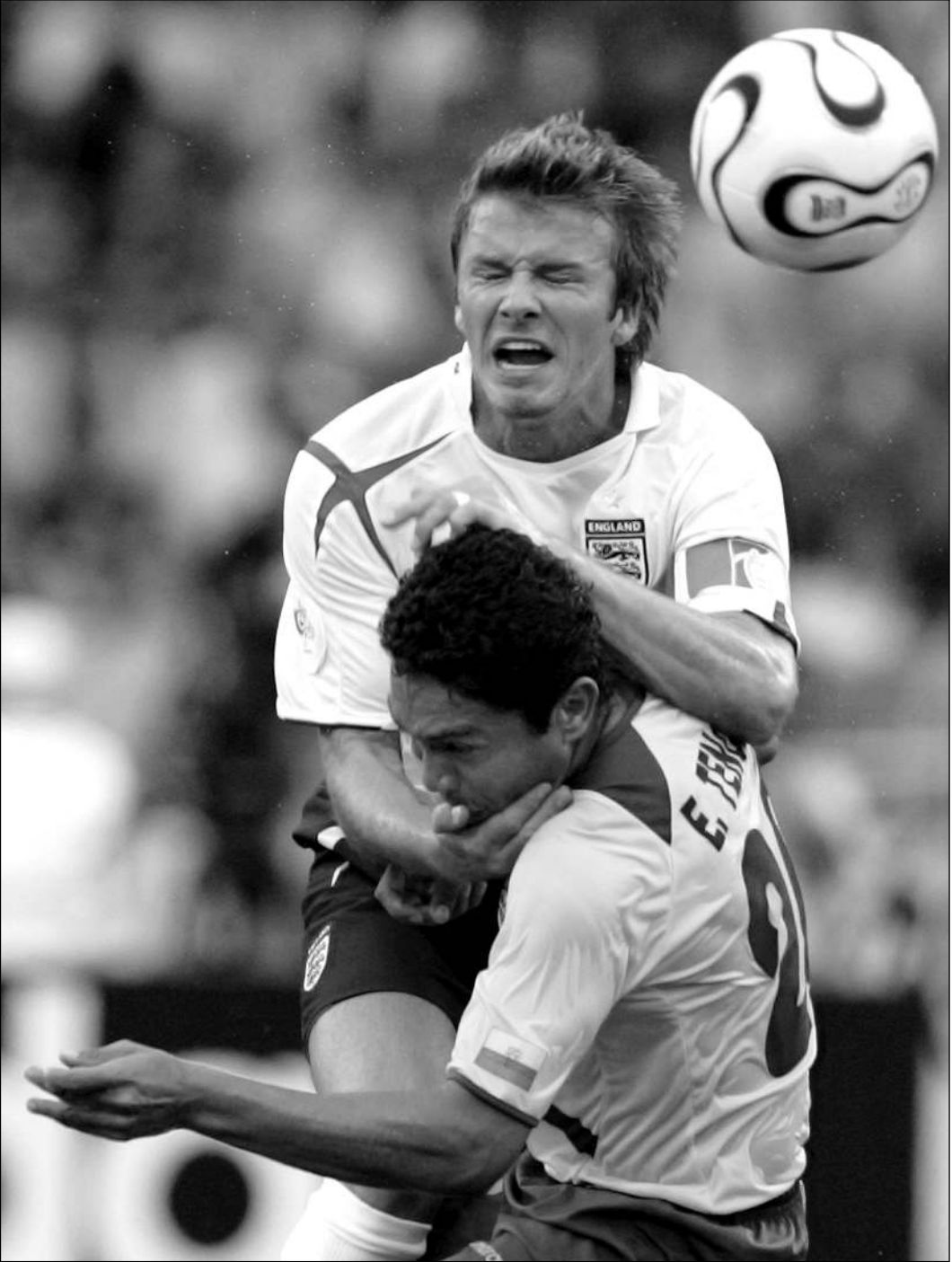
Вчера. Штутгарт. Англия - Эквадор - 1:0. Капитан английской сборной Дэвид БЕКХЭМ против Эдвина ТЕНОРИО.

Кроме того, Англия всегда играла тем мощнее, чем сильнее ее соперник. Поэтому в четвертьфинале вы увидите настоящую сборную. Это я вам как капитан говорю.