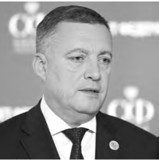
Игорь Кобзев, губернатор Иркутской области

Да, я говорил о введении дифтарифа для майнеров. Но пока на законодательном уровне эта сфера деятельности не урегулирована. Сейчас введение дифтарифа не принесет ожидаемого результата в борьбе с платящей для населения и ухудшения экологической обстановки из-за возможного перехода на печное отопление углем. В этой ситуации надо разобратсья, что служит объектом для критики. Если незаконный майнинг — то тариф не решит проблемы. Давайте вместе обсуждать: что и на каком этапе будем делать, для какой льготной категории будем формировать социальные нормы и как работать с остальными потребителями.