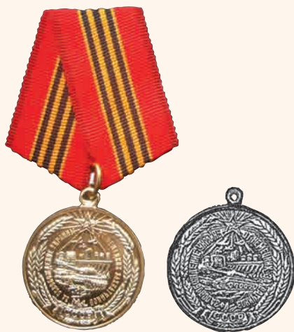
«За освобождение Украины»