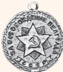
«За освобождение Белграда» Художник Н.И. МОСКАЛЁВ