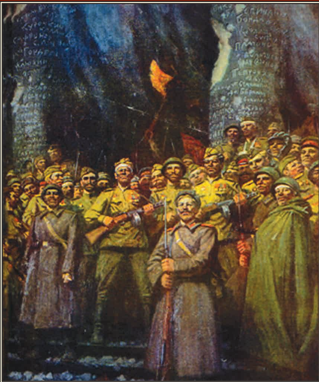
Победа. 1945 г. Художник А. ЛЫСЕНКО

9 мая — День Победы советского народа в Великой Отечественной войне 1941—1945 гг. (1945 год) День воинской славы России