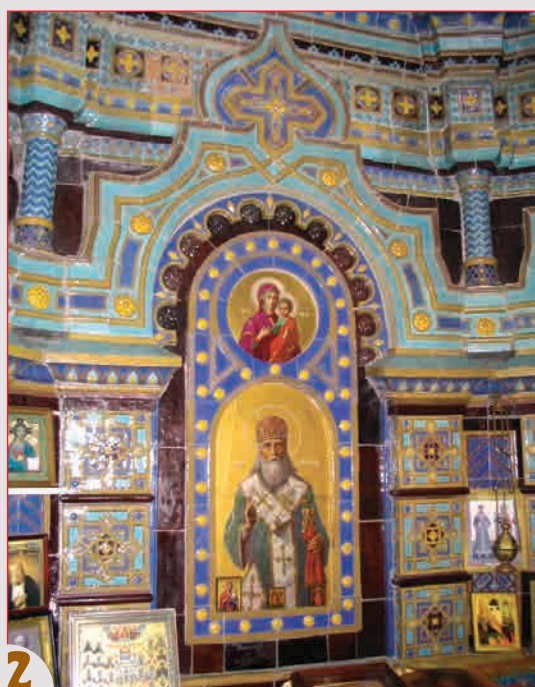
Образы Богоматери с Христом и святого Фёдора Ростовского Внутреннее убранство часовни