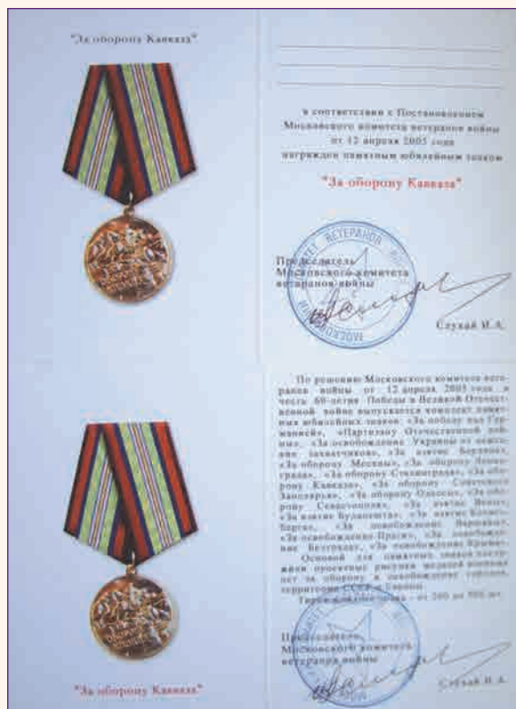
Удостоверение к юбилейному знаку «За оборону Кавказа»