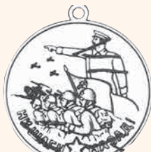
«За оборону Сталинграда» Художник Н.И. МОСКАЛЁВ