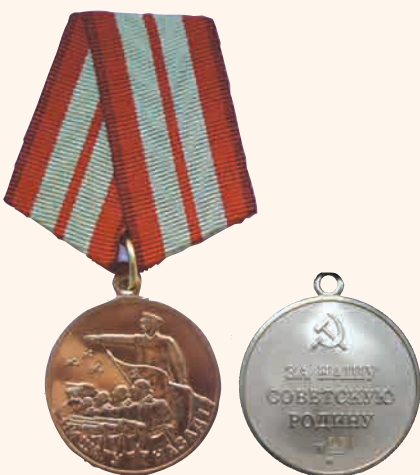
«За оборону Сталинграда» (лицевая и оборотная стороны)