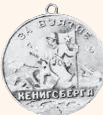
«За взятие Кёнигсберга» Художники Н.И. МОСКАЛЁВ и КИСЕЛЁВ