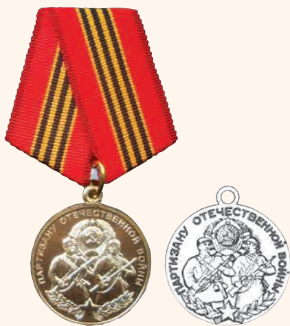
«Партизану Отечественной войны»

Памятные юбилейные знаки, посвящённые неутверждённым проектам медалей Великой Отечественной войны и проектные рисунки этих медалей