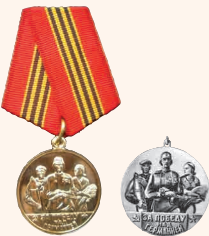
«За победу над Германией»