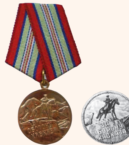
«За оборону Кавказа»