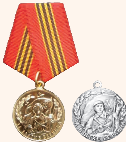
«За взятие Берлина»