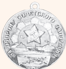
«За оборону Советского Заполярья» Художник И.С. ТЕЛЯТНИКОВ