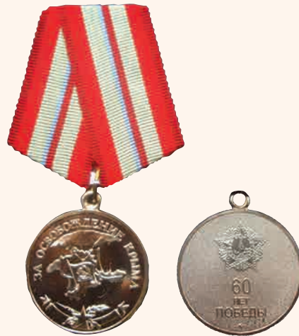
«За освобождение Крыма» (лицевая и оборотная стороны)