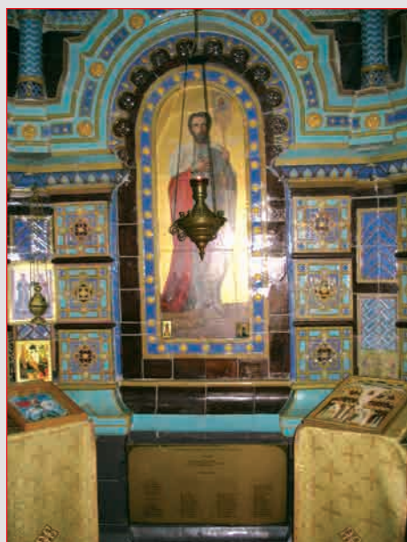
Образ Святого Благоденного великого князя Александра Невского и медная доска с именами павших воинов Внутреннее убранство часовни