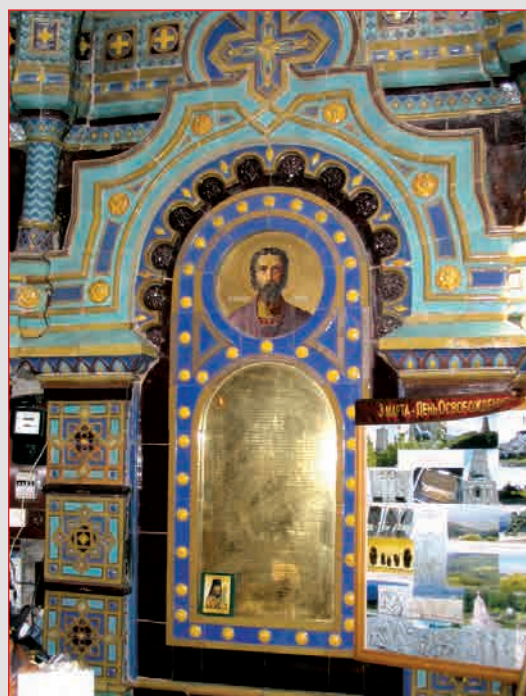
Образ просветителя Кирилла Внутреннее убранство часовни