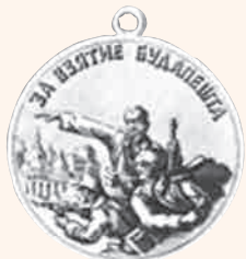
«За взятие Будапешта» Художник АНДРИАНОВ