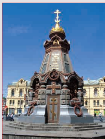
Памятник-часовня гренадерам, павшим под Плевной 28 ноября 1877 года Современный вид