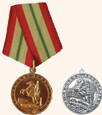
«За оборону Ленинграда»