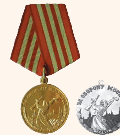
«За оборону Москвы»