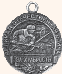
Пробный образец медали «За храбрость» Художник С.И. ДМИТРИЕВ