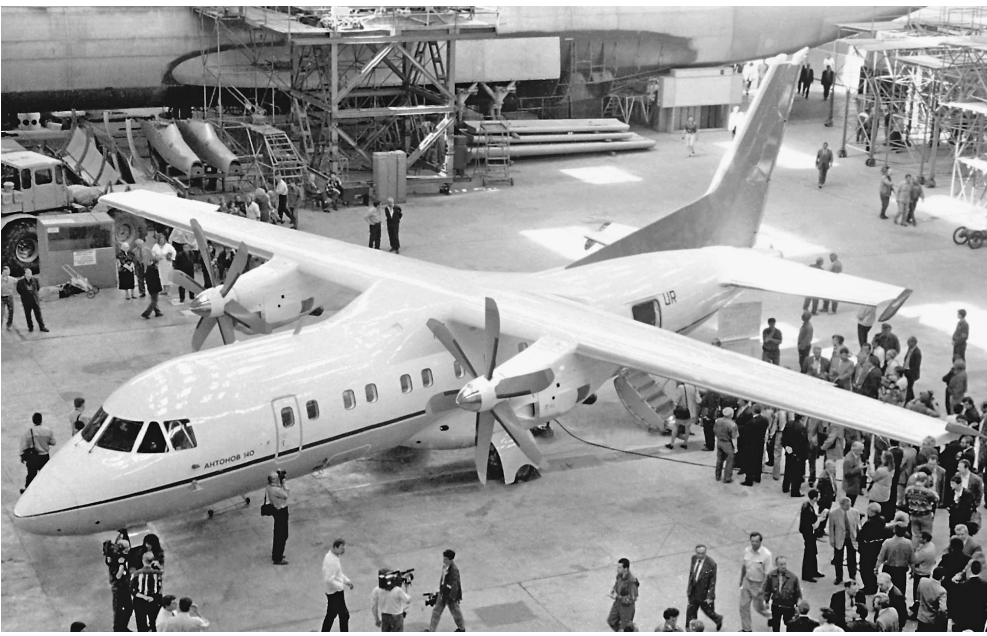
Основными пассажирами нового самолета станут военачальники